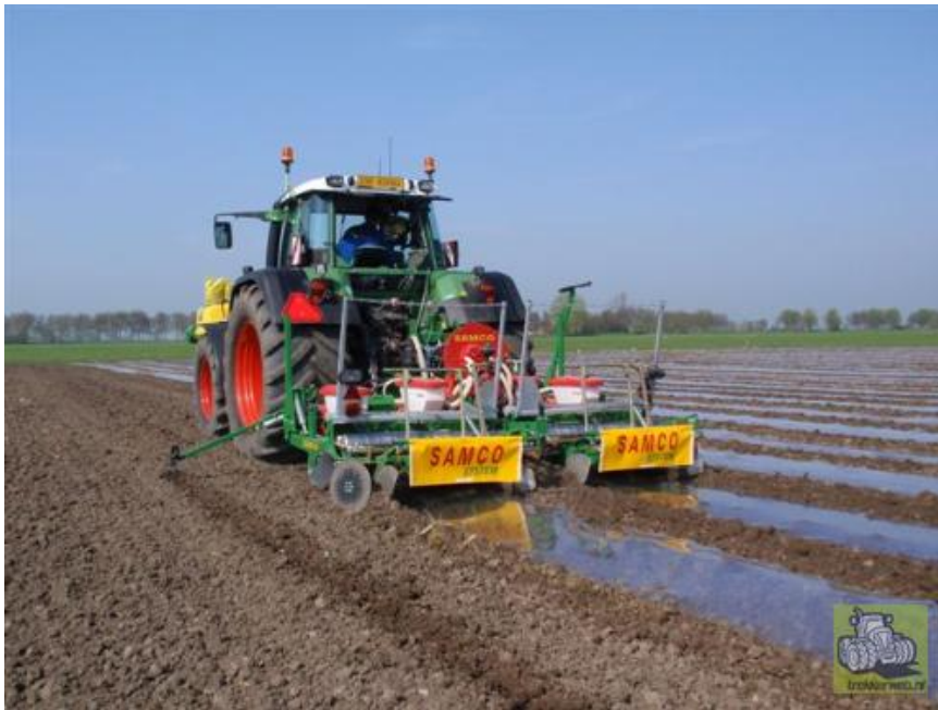
Maïs gezaaid onder folie ontwikkelt zich sneller

In onder andere Amerika past men dit toe om op berghellingen erosie tegen te gaan en om te kunnen irrigeren. Achterliggende gedachte voor Nederland is om onder natte omstandigheden langer te kunnen oogsten door over de ruggen te rijden. Daarnaast zou het de mineralenbenutting kunnen verbeteren doordat de vruchtbare grond naar de maïs wordt gebracht. Er zijn met dit systeem op beperkte schaal ervaringen opgedaan. Onderzoeksgegevens uit Denemarken laten erg wisselende resultaten zien. In 2009 is er door Wageningen Plant Research – Praktijkonderzoek AGV samen met Wageningen Livestock research onderzoek gestart met verschillende grondbewerkingsmethoden, waaronder ruggenteelt, op kleigrond. De opbrengst resultaten waren wisselend.