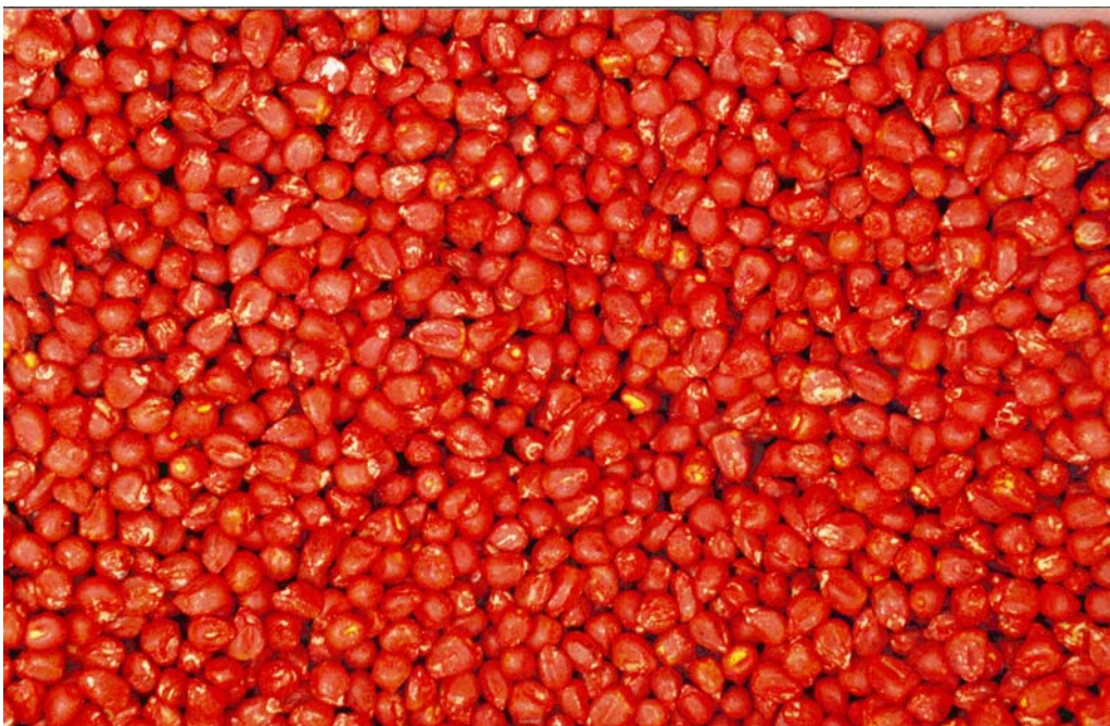
Begin met goed zaad

De veldopkomst is niet alleen afhankelijk van de kiemkracht. Dit komt doordat de kiemingsomstandigheden in het veld vaak veel ongunstiger zijn dan in het laboratorium. Maïs krijgt tijdens de kieming nogal eens te maken met lage temperaturen, waardoor de veldopkomst sterk kan afwijken door inwerking van kiemschimmels. Daarom adviseren we om bij vroeg zaaien meer zaden per ha te gebruiken dan bij later zaaien (zie paragraaf 7.5).