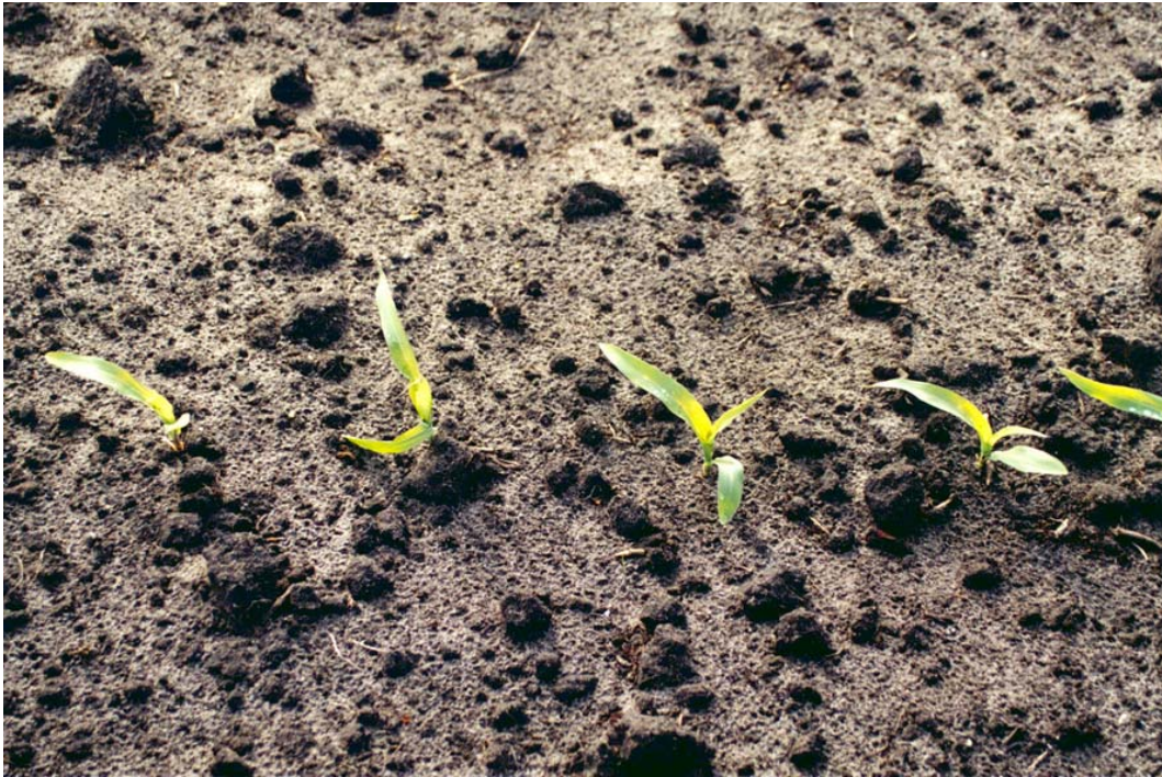
Kies de juiste zaaidichtheid